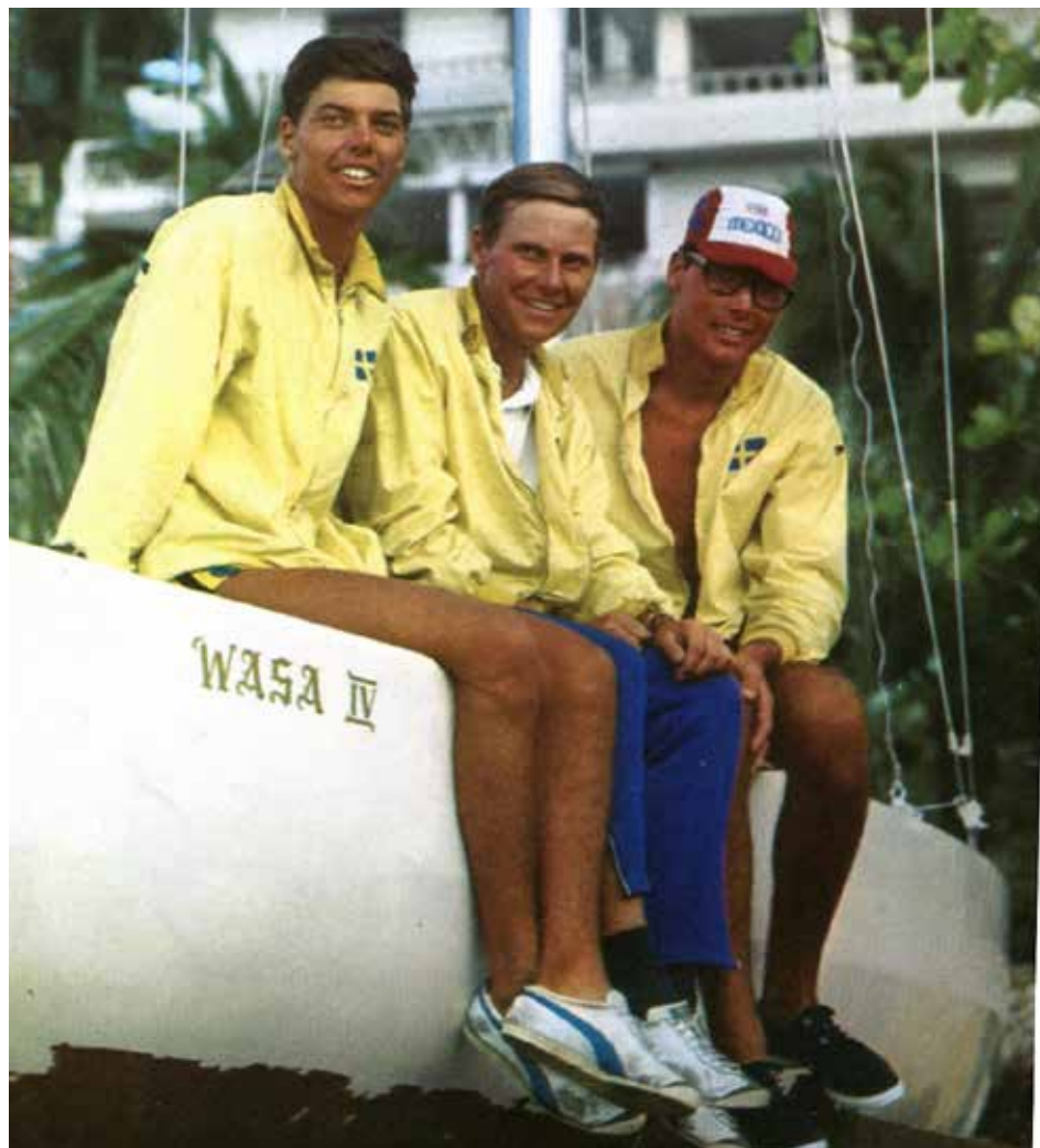
Guldtrion Ulf, Jörgen och Peter Sundelin i Mexiko 1968.