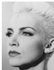
Lika som bär: Marie Fredriksson och Annie Lennox.