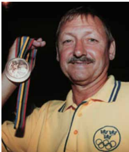
2022 innebär dubbeljubileum för Ragnar Skanåker. För 50 år sedan vann han sin första olympiska medalj – för 30 år sedan tog han sin fjärde och sista, brons i Barcelona.

”Nervös? Det är inte svårt att ha goda nerver för att överleva i det socialistiskt styrda Sverige. Inte om man måste leva