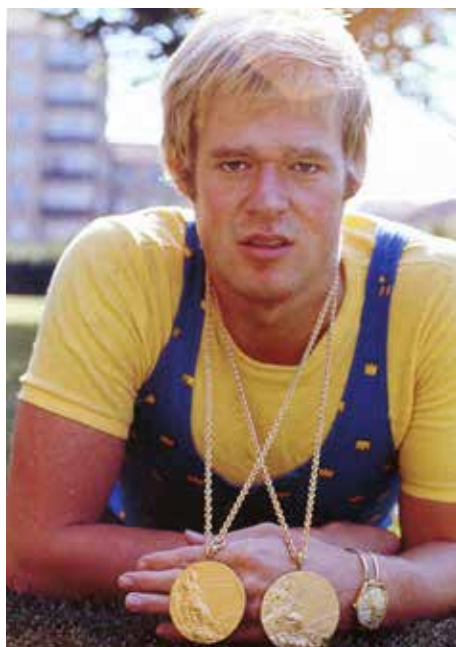
Gunnar Larsson – dubbel guldmedaljör.