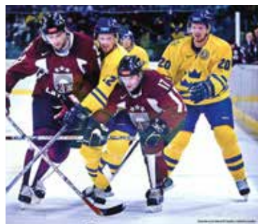
Tvillingarna Sedin i full fart 2006 då de vann guld.