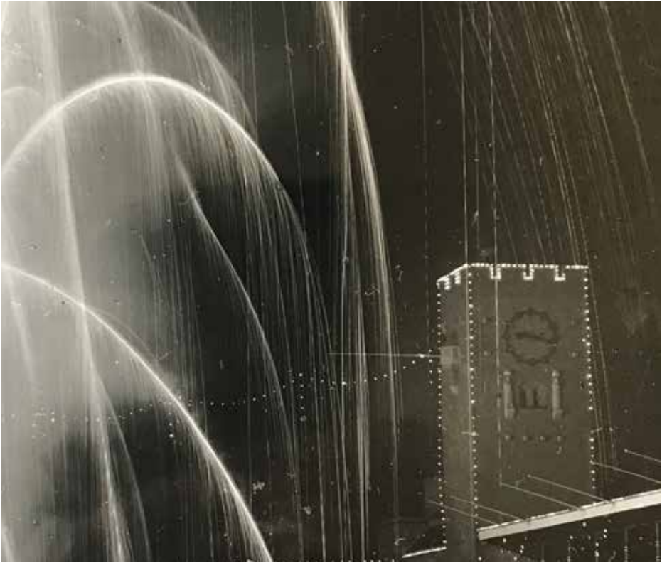
Stadion i festskrud. De egna jubileerna har ibland varit storslagna, andra gånger närmast bortglömda.