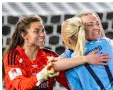
Jubileumsvår 2022. Tuffa vikingar, rugby och jublande djurgårdstjejer.