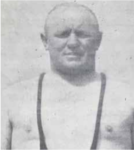
Carl Oskar Westergren var en mästare med humör.

Tre guld på tolv år. Tre guld i tre olika viktklasser. Brottaren Carl Westergrens olympiska guldkavalkad är utan dess like. Den fullbordades i Los Angeles 1932.