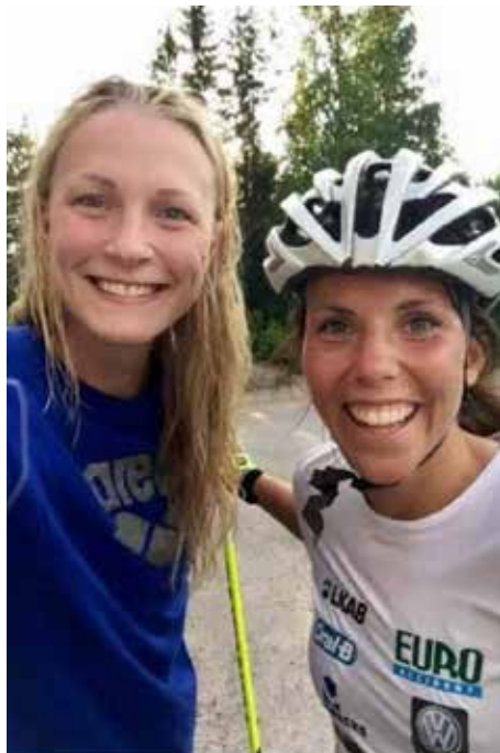
Två överraskade superstjärnor som plötsligt fick reda på att de var släkt.