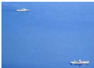
Från flyget såg vi skepp som inte var handelsfartyg. Vi anade inte hur olycksbådande det var. Stridigheter pågår fortfarande.

De stora svenska framgångarna kom inte under vår resa men det var ändå en upplevelse. Från flyget kunde vi se ryska krigsskepp i Svarta havet. Vi ana-