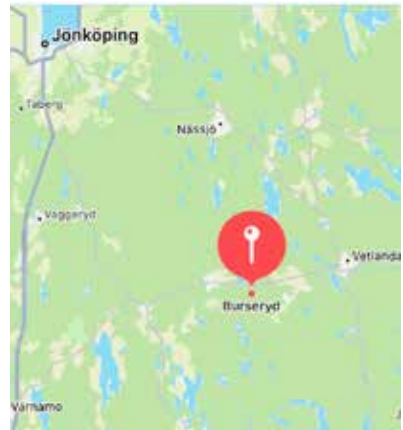
Smeknamnet kom från klubben han representerade, Burseryds IF.

Mycket har hänt under de gångna 60 åren – även inom cykelsporten. Nu har man