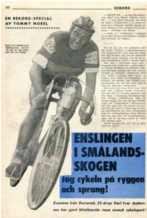
”Burserydarn” porträtterad i Rekordmagasinet nr 14 1957.

da. På kontinenten tävlade han bland annat i Fredsloppet under tolv dagar på sträckan Warszawa-Berlin-Prag där han som fyra blev bäste svensk.