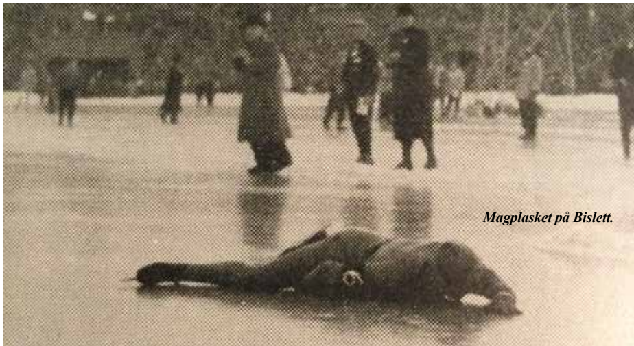
Magplasket på Bislett.

bronspeng på 10 000 m. Det var detta som dåtidens svenska tidningar rapporterade om. Fiffel och droger, sprutor och ampuller, var inget som noterades. Inte heller något om att någon åkare ska ha uppträtt underligt på något sätt.