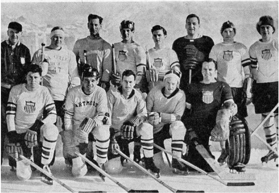
Avery Brundages amatörlag som representerade USA under OS-invingningen i S:t Moritz, men som aldrig fick spela. Som hämnd såg Brundage till att det mera proffsbetonade USA-laget diskades i efterhand.

AHA:s mera proffsiga lag. När detta stod klart utbrast Brundage: