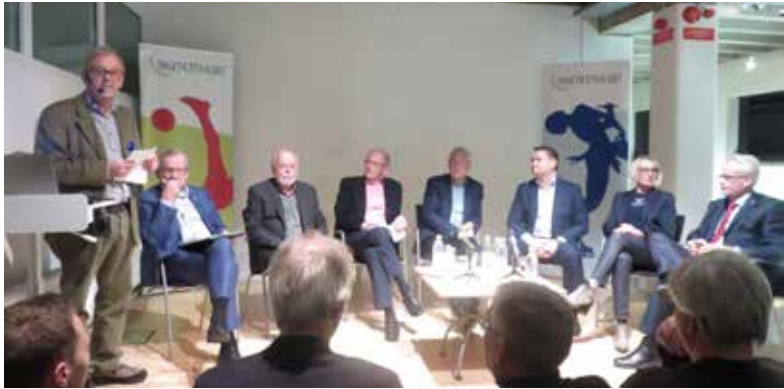
Panelen under hösträffen.

– Politiskt gäller det att ligga rätt. Det är lättare att driva stora projekt som OS om det inte är valtider. I annat fall får man räkna med att det finns partier som försöker vinna enkla debattpoäng.