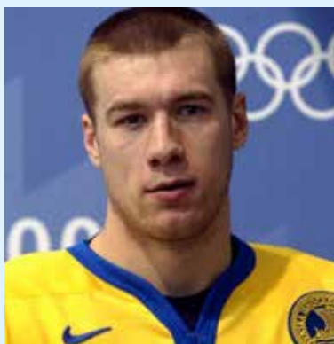
Matthias Öhlund och Daniel Alfredsson har deltagit vid samtliga fem OS-turneringar där NHL-proffs tillåts vara med.